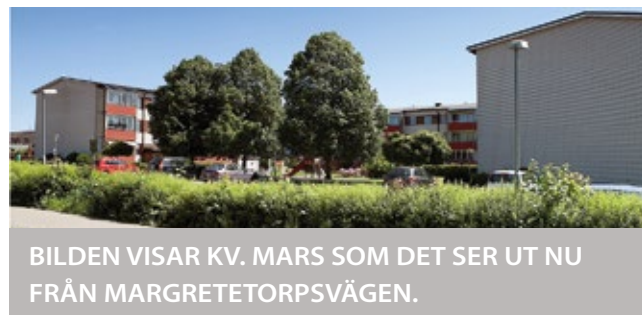
BILDEN VISAR KV. MARS SOM DET SER UT NU FRÅN MARGRETETORPSVÄGEN.

Arkitekter i Helsingborg. Just nu pågår en process om planändring och byggstart hoppas vi kan ske någon gång under 2019.