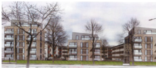
MARS 1 HAR FÅTT KLARTECKEN FRÅN KOMMUNEN