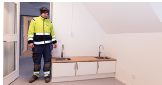
ETT AV DE FYRA LEKKÖKEN VI BYGGT TILL FÖRSKOLAN

anpassa lokalerna till barnverksamhet med särskilt fokus på säkerhet och trivsel. I anslutning till fastigheten har en lekplats skapats samt en plats för vila och fika. Nu längtar vi efter att lokalerna fylls med skratt och glädje!